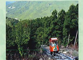
奥祖谷観光周遊モノレール