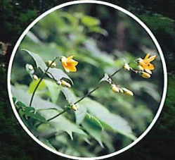
キレンゲショウマ

国定公園指定50周年を迎えた剣山(つるぎさん)は、徳島県西部「にし阿波」に位置する標高1,955mの西日本第二の高峰で、日本百名山の一つです。別名を太郎笈(たろうぎゅう)とも呼ばれ、頂上は隆起準平原と呼ばれる平らな地形に笹原が広がっています。一帯は剣山国定公園に指定されており、山頂付近の「剣山御神水」は環境省の名水百選にも選定されています。夏には世界でも希少な植物であるキレンゲショウマの凜とした黄色い花が訪れる人々を迎えてくれます。