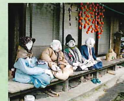
天空の村・かかしの里