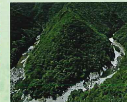
祖谷溪(ひの字溪谷)