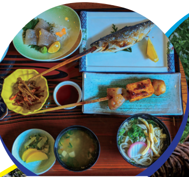
照片僅供參考，不等同實際餐食。